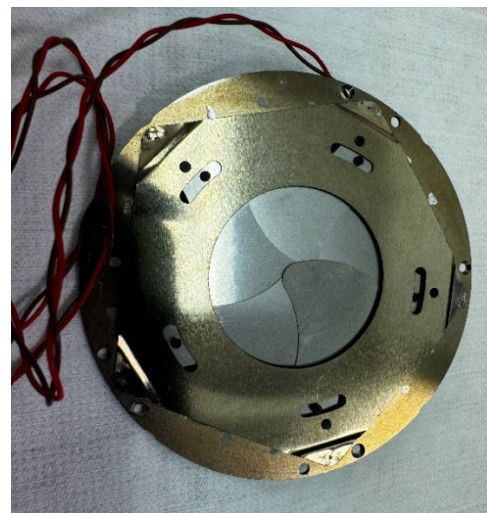
Figure 3: View of the target with the shutter portion modified with a titanium blade.