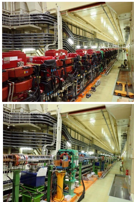
Figure 5: Oho straight section before(upper) and after(down) remodeling.

Figure 5 は改造前と現在の大穂直線部の写真である。ウィグラー電磁石が撤去され、四極電磁石およびステアリング磁石が再配置されている。このように改造作業は順調に進んでいる。