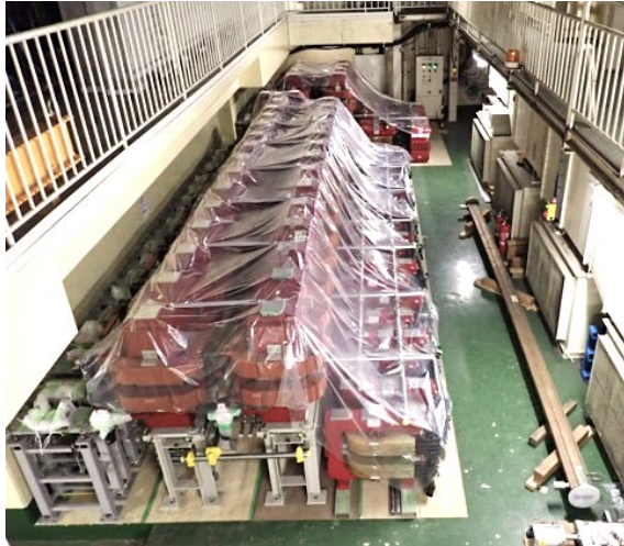
Figure 2: The removed wiggler magnets

後直線部中央部分から順にウィグラー電磁石をビームラインから取り外し大穂直線部架橋下のスペースに並べ保管している(Figure 2)。特にダブルポール電磁石は、将来 HER ラインで使用する可能性があるため、ホローコンダクター内に窒素ガスをパージして保管を行っている。