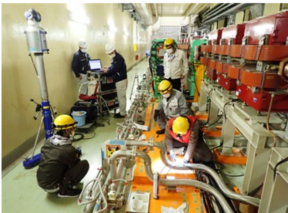
Figure 3: Marking the center of the electromagnet and the tapped hole position

大穂直線部には高さの違う 2 種類ベースプレートが存在する。1 つは KEKB 時代に製作された床面から高さ 90 mm ほどのベースプレートで、改造前の四極電磁石はこのプレートに設置されていた。もう 1 つは、SuperKEKB 時代にウィグラー電磁石を設置するために