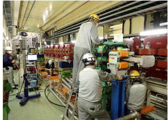
Figure 4: Alignment of quadrupole magnets

製作されたもので高さは床面からおおよそ 120 mm である。今回の再配置で 90 mm プレートに乗っていた四極電磁石を 120 mm プレートに設置する必要があった。そのまま設置すると磁石中心がビームラインより上になり、架台の調整範囲を超えてしまうため、120 mm プレートに設置する四極電磁石の架台を数十ミリ短くする加工を行った。架台加工が終わった後、架台のアライメントを行い、レーザートラッカーを用いて電磁石の精密アライメントを行った(Figure 4)。