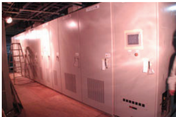
図1. 新ブースターシンクロトロン電磁石電源。

シンクロトロンはまず600MeV加速を再現することを最優先にコミショニングを行い、比較的順調に立ち上げることができた。その後およそ半年間運転を継続した後、入射路の偏向電磁石の更新が完了したのを受けて、フルエネルギー加速、フルエネルギー入射の調整を開始した。数回のスタディにより750MeVまでの加速器に成功し、引き続きリングへのフルエネルギー入射にも成功した。7月よりユーザー運転もフルエネルギー入射で実施している。7月末現在で入射レートは、加速繰り返し1Hzで0.5mA/secであり、実用上は問題がないが、さらに入射レートを向上するべくスタディを継続している。