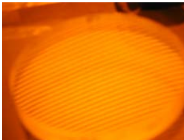
図2 \lambda/16 の面精度に仕上がったガラス

配置し、真空と大気の仕切り窓に2)ガラス窓を使用する。この為、放射線劣化の少ない材質を使用することを基本として製作しなければならない。