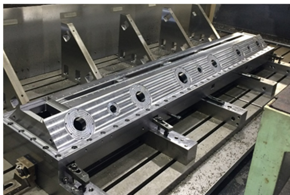
Figure 2: Machined RFQ part (top part).