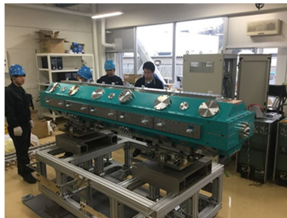
Figure 4: The RFQ installed at RIKEN.